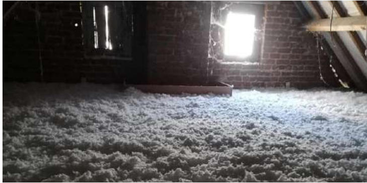
Coût : 5800HT. 5800€ de subvention CEE.

Profitant des Certificats d'Économies d'Énergies «CEE» nous avons fait isoler gratuitement par l'entreprise Lowcalbat, les combles de plusieurs bâtiments communaux : école, vestiaires du foot et nos 3 logements communaux, soit 350m 2 isolés avec 30 cm de laine de roche. Une bonne nouvelle pour nos futures factures d'électricité !