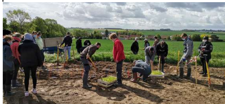
Coût : 1.800€HT pour la Fascine pris en charge par la commune – 550€TTC pour les plants pris en charge par les agriculteurs.

Dans le champ, nous avons fait appel au Lycée Agricole de Tilloy pour un chantier école : 1300 pieds de miscanthus ont été plantés sur 230m 2 . D'ici 2 à 3 ans, ils devraient retenir une majorité des limons. Au regard, du dernier orage, nous avons convenu avec la profession agricole d'envisager des travaux complémentaires pour tenter de limiter autant que de possible ce phénomène de ruissellement.