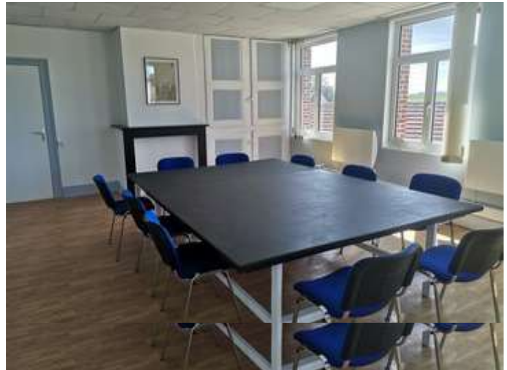
Coût rénovation : 520€HT – Coût de la modernisation du réseau informatique : 902€HT

Pendant la période hivernale, la salle de l'étage de la mairie a été transformée en salle de réunion. Ces travaux ont été entièrement réalisés en régie : notre employé communal a vidé la salle, détapissé et enduits les murs. Avec le 1er adjoint, ils les ont repeints et installé de nouveaux radiateurs. Cette salle est à disposition des associations communales pour leur réunion. Le Maire a profité de ces travaux pour moderniser, également en régie, le réseau informatique des bâtiments communaux (câblage, serveur de stockage et sauvegarde, ponts wifi et passage à la fibre). Cette mise en réseau a permis de diminuer de 3 à 1 abonnement internet pour la mairie, la cantine-garderie et l'école... une économie d'environ 1900€ à l'année.